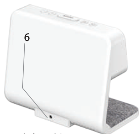
6. アダプター挿入口